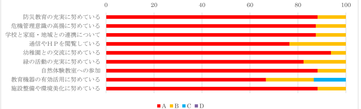
学校の様子 (生活・環境)