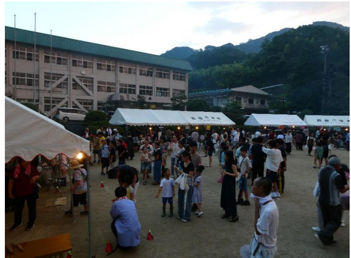
西谷納涼盆踊り大会