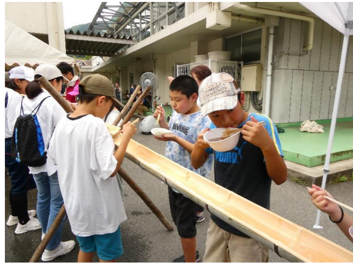
第2回自然体験教室（大そうめん流し）